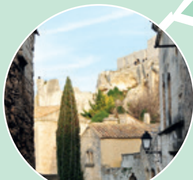
Les Baux de Provence