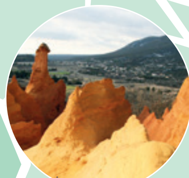
Le Colorado Provençal